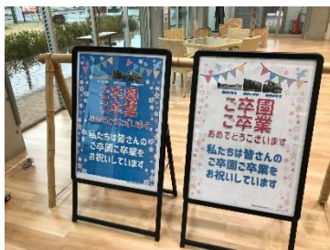
ご卒園・ご卒業のお祝い

新型コロナウイルスの影響で休校・利用自粛・休館などで皆さまには大変ご迷惑をおかけしました。きさてらすではこの時期だからこそ金田地域の皆様のためにできることを考え、取組んで参りました。その一例をご紹介します。今後も安全な施設づくりに努めて参ります。