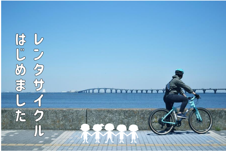
木更津市観光協会