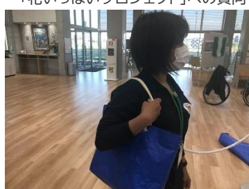
台風15号19号で使用したブルーシートからエコバッグ制作