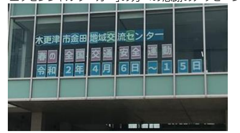
春の交通安全運動