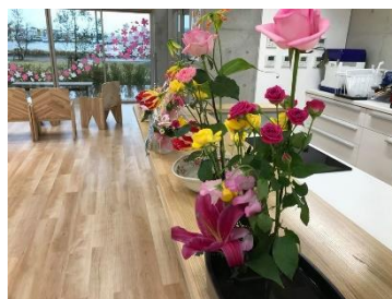
「花いっぱいプロジェクト」への賛同