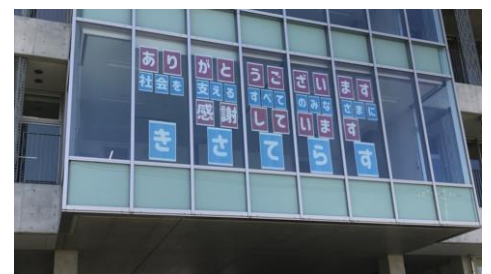
「エッセンシャルワーカー」の方への感謝のメッセージ