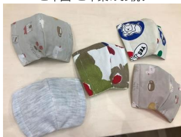
マスクの制作と寄付