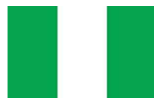
ナイジェリアの国旗