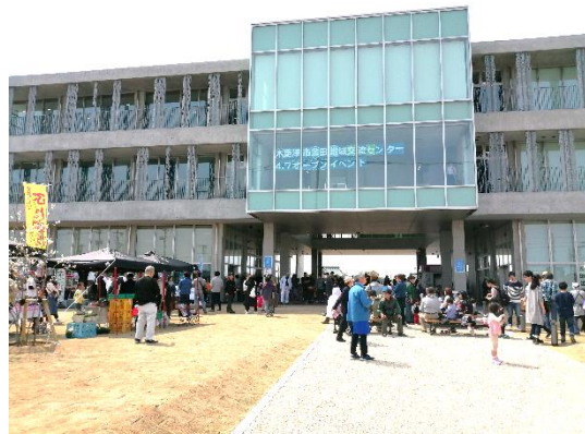
2019年4月7日(日)オープニングイベントの様子

金田の皆さまに愛されて、「きさてらす」はまもなく開館から1年を迎えます。開館1周年を記念して4月最初の日曜日、4月5日に1周年記念イベントを開催します。イベント出演者、出展者の詳細が決まりましたら追ってお知らせします!ご期待ください!!!