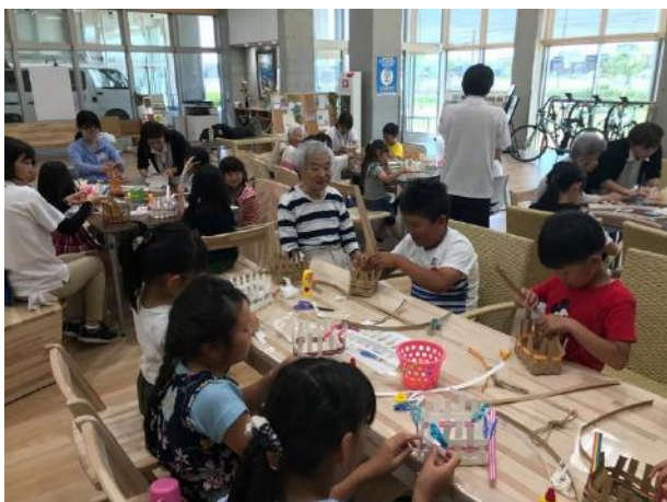
高齢者の“先生”から教わって「かご」を作りました！

6/17（月）振替え休日大作戦が無事に終わりました。月曜日、施設は休館日ですが、6金田小中学校が運動会の振替え休日の為、子どもたちの居場所づくりと、働く保護者支援を目的にイベントを開催しました。