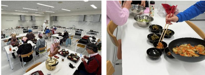
きく芋を使った和ベジ精進料理教室の様子