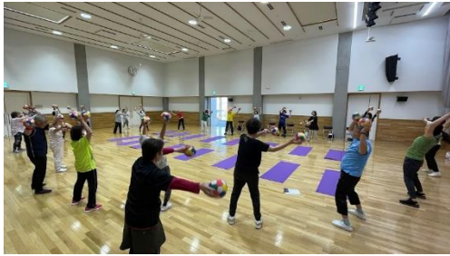
5月 エンジョイボールエクササイズ