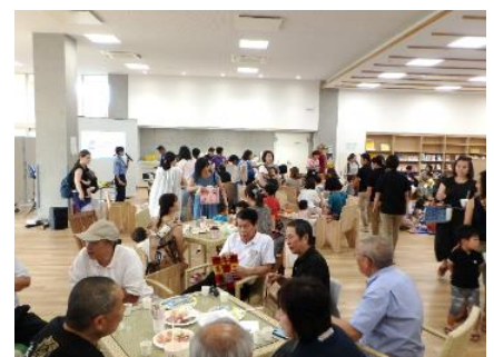
きさてらすコミュニティカフェ風景