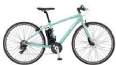
電動アシスト付クロスバイク CAMALEONTE-E

▶ 車種 イタリアンの老舗自転車メーカー Bianchi(ビアンキ)製 電動アシスト付クロスバイク、マウンテンバイク、クロスバイク