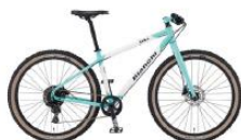
マウンテンバイク SIKA / KUMA